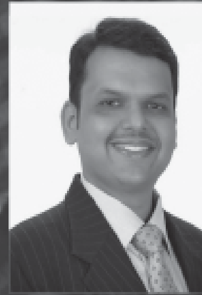
PRESIDED BY SHRI DEVENDRA FADNAVIS

HON'BLE UNION MINISTER OF TEXTILES, GOVT OF INDIA